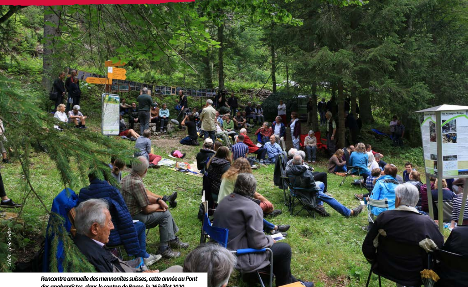
Rencontre annuelle des mennonites suisses, cette année au Pont des anabaptistes, dans le canton de Berne, le 26 juillet 2020.